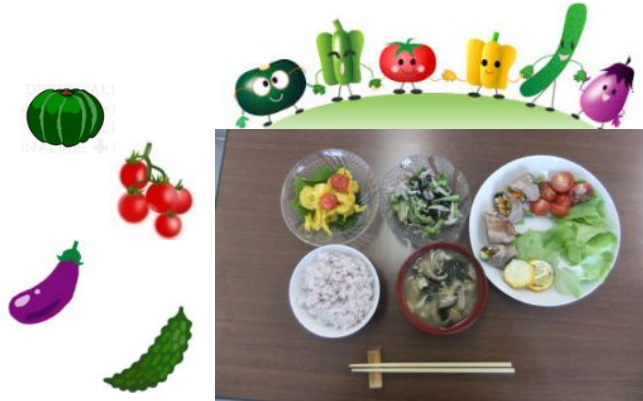
出来上がった今回の料理