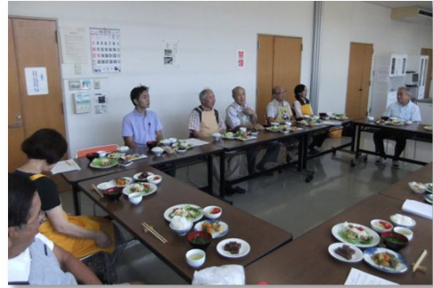
最後に皆さんで頂きました