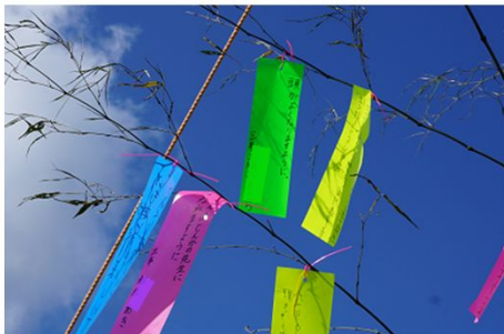
願事は「頭がよくなりますように」と書いてあります。

撮影の日は快晴で、まぶしい青空を背景に短冊が風に吹かれていました。みんなの願いが届きますように！