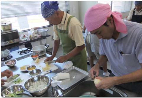
じゃが芋の皮むき

その後、今回のメニューの「鶏肉のから揚げレモンのおろしあんかけ」、「じゃが芋とインゲンのおかか煮」、「トマトと玉ねぎの粒マスタードサラダ」、「とろろ昆布のすまし汁」、デザート「水ようかん」作りに挑戦されました。1時間位で料理が出来上がり、皆さんとおいしく頂きました。次回は12月に開催予定です。料理に挑戦したい男性の方、食改の方に優しく指導して頂けますのでどうぞ気軽に参加してみてください。