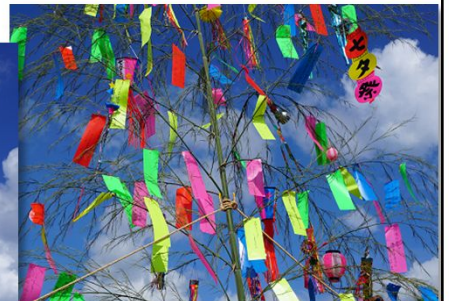
青空を背景にした色とりどりの短冊