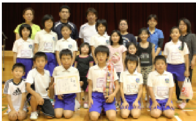
優勝した古川上町チームのみなさん