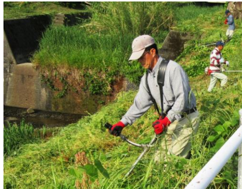
棚底川周辺の作業風景

前々回の棚底村庄屋さんに引き続き、今回は庄屋と共に村三役である百姓代と年寄関連を紹介します。わずかに残されている棚底村の古文書で村三役の名前は出てきますが、庄屋以外は苗字が書いてありませんので困ります。