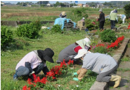
振興会花壇の手入れをする部会員ら

振興会としては、引き続き「環境美化作業」を通じて、棚底地区への郷土愛と景観保持に努め、交流人口増を図って行きたいと思っております。