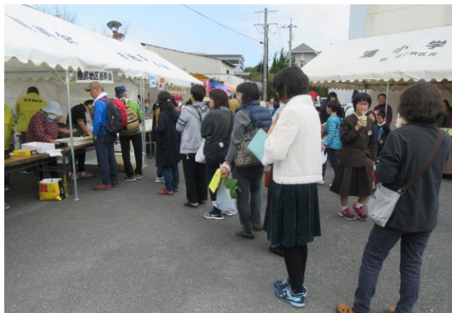
「がねあげ」を求めて長蛇の列＝バザー会場