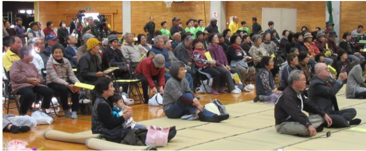
ステージ発表を観覧する町民ら＝倉岳体育館会場