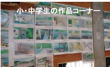
小・中学生の作品コーナー