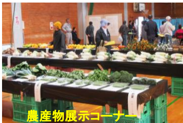
農産物展示コーナー

倉岳町棚底1786-4 棚底地区 コミュニティセンター Tel.64-3664 fax63-7544