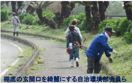
棚底の玄関口を綺麗にする自治環境部会員ら