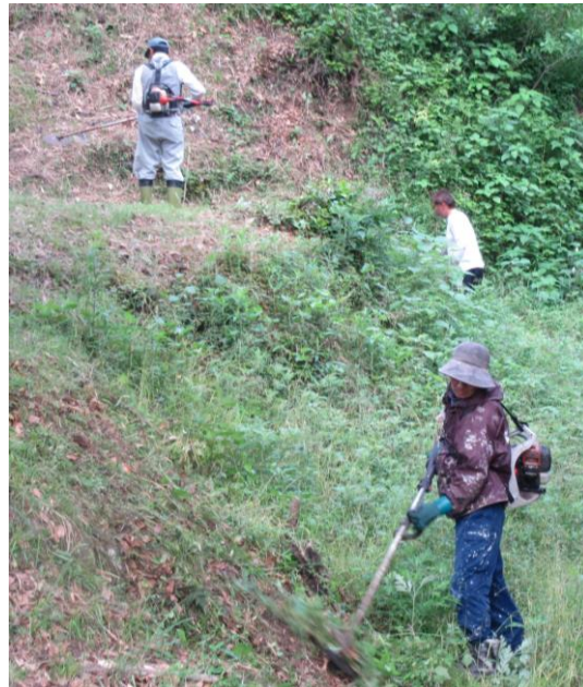
城郭壁面の草を刈る地域づくり部会員たち