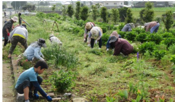
振興会花壇の草を引く健康福祉部会員ら