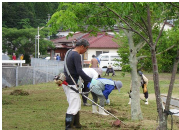
地区民総出で草刈作業やごみ拾いに汗流す棚底5区

「一日一汗運動」で「どこもかしこもスッキリ！」 今年も6月6日(日)に「二日一汗運動」が町内一斉に行われました。この事業は、清掃活動を通して環境美化への関心や意識を高め、住みよいまちづくり、郷土を愛する心を育んで頂くことを目的に区長会などが毎年実施しているものです。 当日は、各地区とも区長さんを中心に地域住民が総出で道路沿いや空き地の草刈作業をはじめ花壇の除草やごみ拾いに汗を流し、どこもかしこも見違えるようにきれいになりました。 なお、収集したごみは、分別し、たうえ、倉岳支所に集められ翌日清掃センターへ搬送されました。皆さんお疲れさまでした。