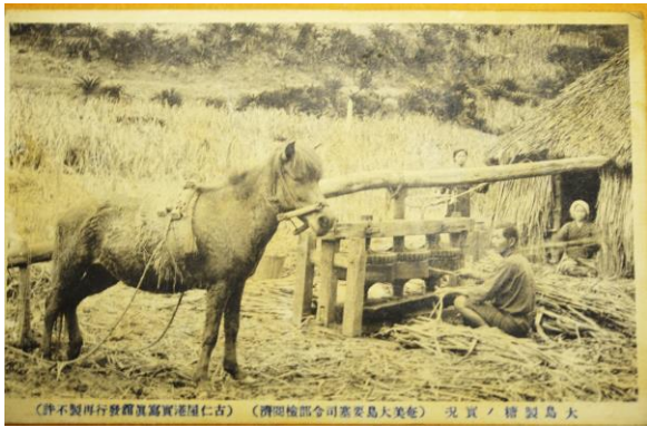
（伊予製糖所製糖機製糖場仁古）（徳島製糖所製糖場大島） 大島製糖所

ています。前回で紹介したように、サトウキビ搾りはかなりのスペースが必要で、下の写真のように↓↓