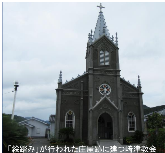
「絵踏み」が行われた庄屋跡に建つ崎津教会