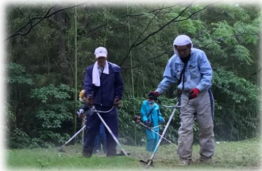
↑棚底城跡を作業する地域づくり部会員ら