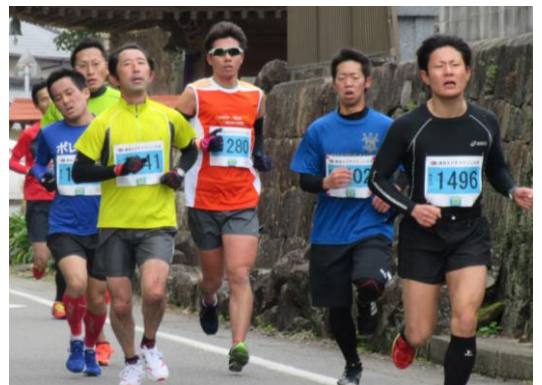
足取りも軽やかに 3、5キロ地点の集団

2016倉岳えびすマラソンに今年は、県内外から過去最高の1541名の参加申込みがあった。今回は、大会を盛り上げるため、振興会も役員を中心山本商店横に給水所を設置した。初めての試みで、試行錯誤を重ねての準備だった。給水所では、飲料水とバナナなど食べ物を用意した。胸突き八丁に当たる地点だけに選手も疲労困憊。チョコや飲料水を補給した選手は足取りも軽やかにゴールを目指していた。