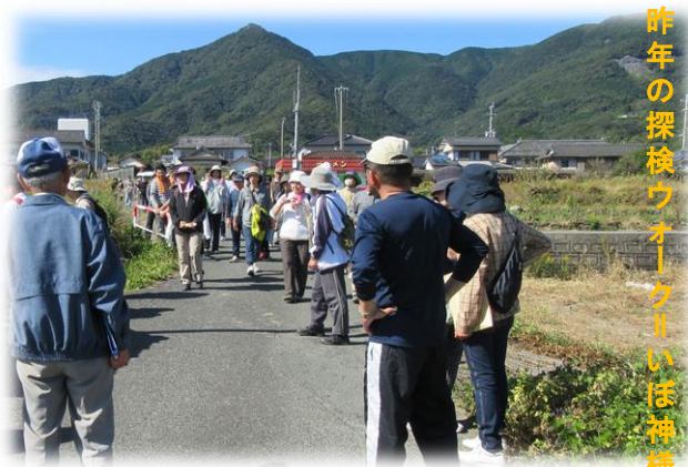
昨年の探検ウオークラリーいぼ神様

昨年まで、四月の第1日曜日に開催していた倉岳ウオークラリーを平成28年度事業から十一月に変更予定です。変わって、 今年の四月 には、 棚底探検ウオークを開催 します。アイラトビカズラや棚底に点在する文化財を巡りながらのウオークで、健康ポイントも加えられるよう要望中、是非ご参加ください。