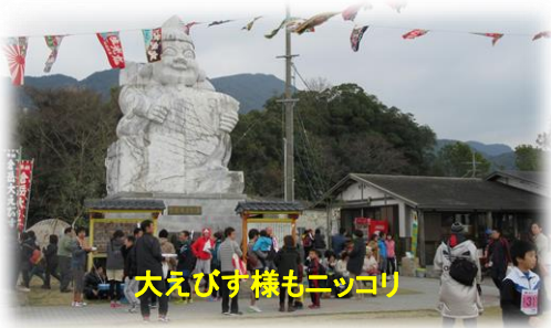
大えびす様もニコリ