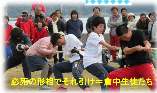
必死の形相でそれ引け=倉中生徒たち