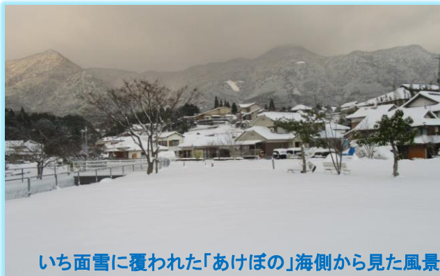
いち面雪に覆われた「あけぼの」海側から見た風景