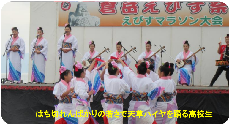
はち切れんばかりの若さで天草ハイヤを踊る高校生