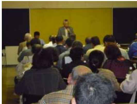
一町田公民館で行われた 振興会総会