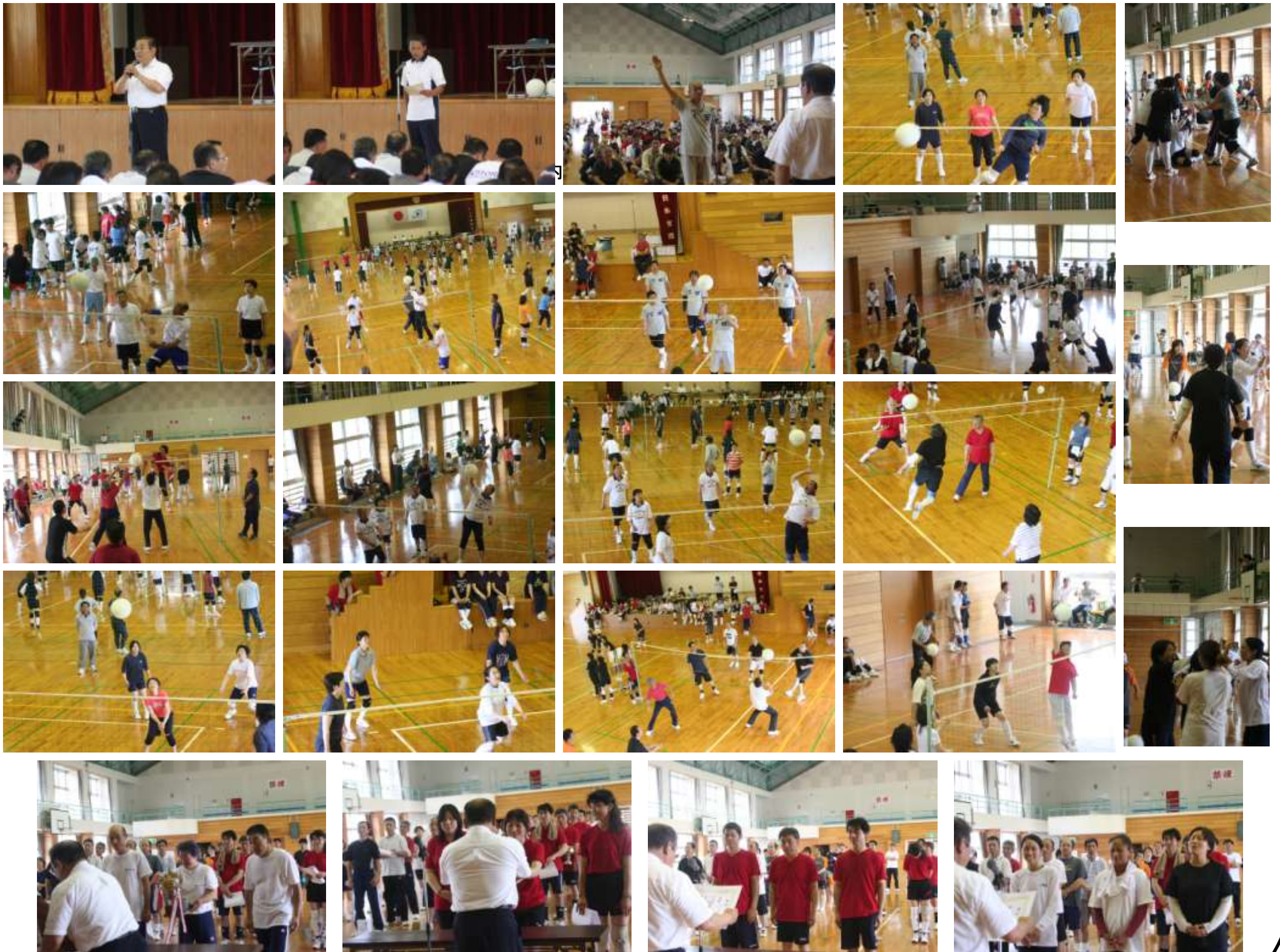
50歳以上混合 優勝 葛河内区