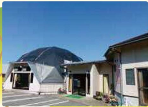
12 天草ゆ楽園 P17

町内唯一の温泉施設で、入浴後はツルツルとした感触が肌に広がります。食事処も完備され、唐揚げやスペシャルカレー、また日・月曜日提供されるラーメンは絶品です。毎週火曜日が定休日。 ☎0969(46)3926