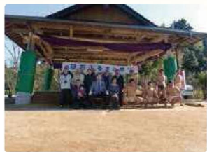
10 碓石ふるさと祭り P15