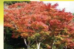
6 金比羅宮公園の紅葉と桜