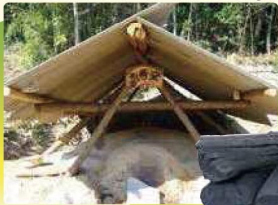
●社会福祉法人 晃明会 P19

11 ひま陣工房 地区の高齢者で構成する「ひま陣会」で炭焼きを行っています。木炭(特に樫)は長持ちすると好評で、熊本市内や地元焼肉店との取引を行っています。