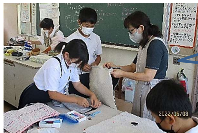
6年生ミシン 指導の様子

今後もクラブ活動をはじめ、例年行っている様々な活動を、感染症対策に十分注意しながらやって参ります。皆様のご協力をどうぞ宜しくお願い致します。