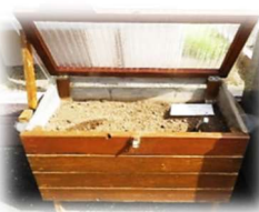
バクテリア de キエーロ

6月1日、北地区コミュニティセンターで生ゴミ処理器(バクテリア de キエーロ)の講習会を実施しました。遠くは牛深からも参加して頂きました。「どんな土でもいいのか」「魚の骨なども入れていいのか」「肥料として使えるのか」など、参加者は質問したりして熱心に聞き言っていました。