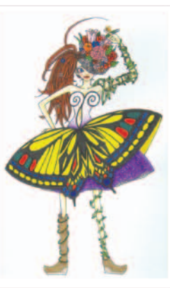
優秀賞を受賞した作品

この他にも多くの工夫をしました。本番では、十分に活かしきれなかったように、意識を高めて練習に取り組んでいこうと思います。