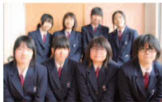
演劇部員のみなさん

また、役の台詞や動きの一つひとつの「間」を大事にするようにしました。大事な台詞の前に適度な間を作ることで、観て下さる方々をより舞台の世界へ惹きつけることができました。