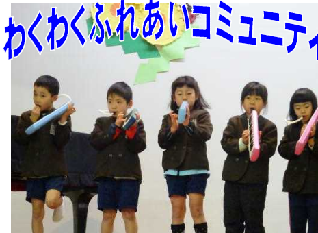
【全学年 本町っ子フェスティバル】