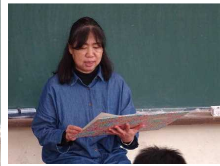
【2年国語 三まいのおふだ】