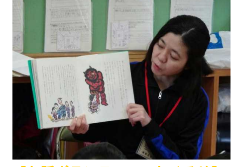
【お話ボランティア むくろじ】