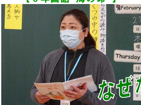
【5年国語 わらぐつの中の神様】