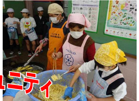
【物作りクラブ 郷土料理づくり】