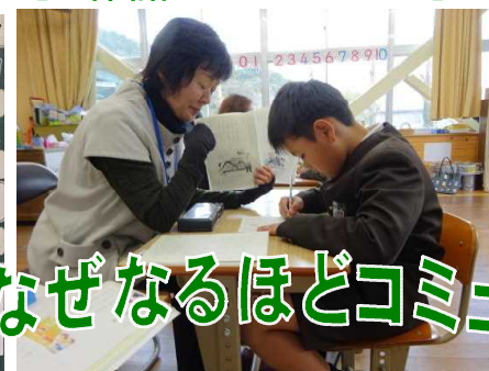
【1・2年 学習支援ボランティア】