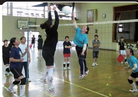
▲熱戦が展開された決勝戦「大矢崎 対 おおやざき一ず」

7月4日、「北地区女子ソフトバレーボール大会」を北小学校体育館で開催しました。これは、北区民の親睦と融和を深めることなどを目的に北体育振興会が実施しているもので、今年で11回目。大会には、北地区在住の女性チームや公民館サークルチームなど6チームが参加。各チームとも、日ごろの練習の成果を十分に発揮し、白熱した好ゲームを繰り広げていました。結果は、大矢崎が優勝、準優勝・おおやざき一ず、3位・TENGU凛でした。