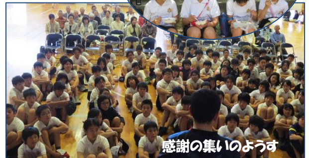
児童と一緒にカレーライス