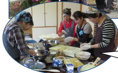
豚汁、おにぎりなどでおもてなし！

4月29日、広瀬区自治公民館をスタート・ゴールとする約5.5kmのコースで「広瀬区つつじ祭ウォーキング」が開催されました。広瀬公園の360度のパノラマの展望台、約50匹の鯉が泳いでいる広瀬川、土手の淀川つつじなどを眺めながら、楽しんで歩いていました。ゴール後には、地区の女性の方の協力で豚汁、おにぎりなどが振る舞われたほか、広瀬川両岸に咲くつつじの写真入り絵はがきなどが配られ、新和町、河浦町、有明町から参加された皆さんは、「たのしかった」「よかった～」と満足そうに話されていました。