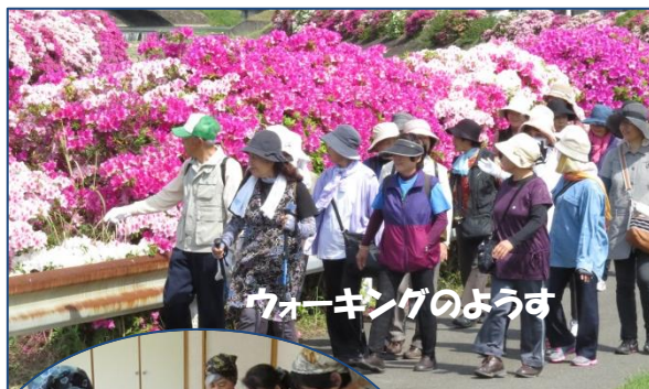
ウォーキングのようす