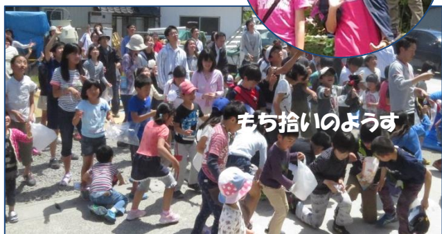
もち拾いのようす