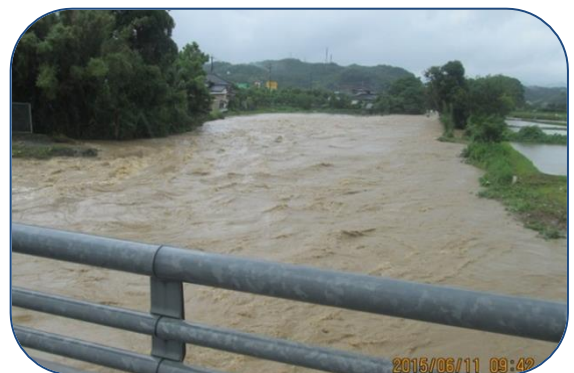
6月11日の豪雨・広瀬川上流