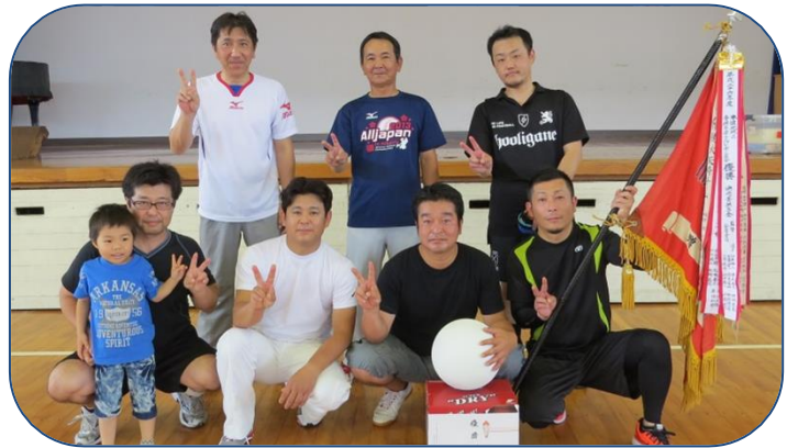
優勝した浜崎チームの皆さん