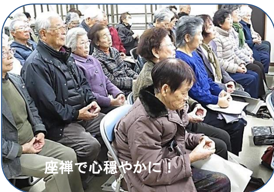
座禅で心穏やかに!