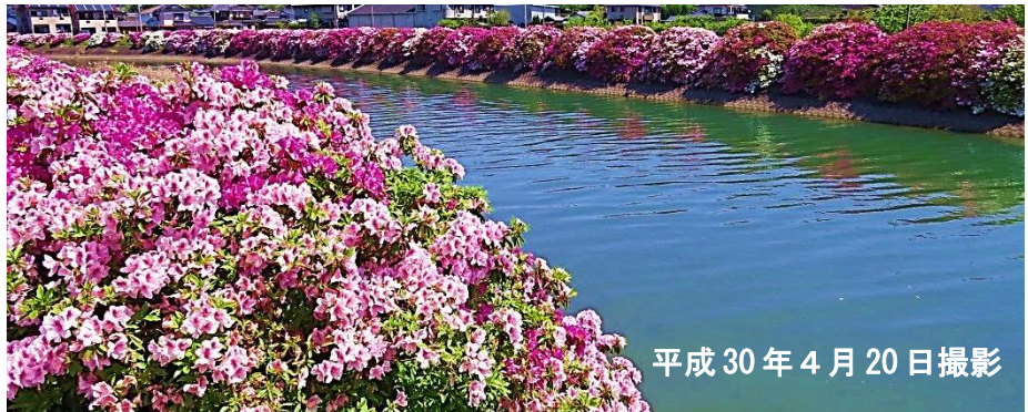
平成 30 年 4 月 20 日撮影

広瀬川兩岸に咲くツツジは、昭和 50 年に旧本渡市と地元の今釜区と広瀬区の住民が植えたもので、その後も両区民がツツジの植栽や剪定などの維持管理を行っています。毎年広瀬区はつつじウォーク、今釜区はつつじ祭りが開催されています。