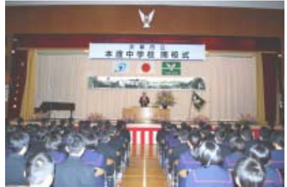
本渡中学校 閉校式典の様子

今までの本渡中学校の学びやはなくなり、これからは本渡南・北・本町・佐伊津町の4地区の中学生と一緒に、大矢崎に新しくできた新本渡中学校で学ぶこととなります。しかし、今までの本渡中学校で育んだ“素直”“勤労”“創造”の精神は受け継ぎ、今後益々羽ばたくことを願っています。