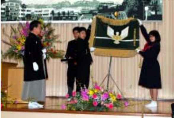
生徒達により校旗が収納されました

2月28日(日)、昭和22年の創立以来19,648名の卒業生を送り出した本渡中学校63年の歴史に幕を下ろす閉校式ならびに閉校記念碑除幕式が行われました。閉校式には生徒や保護者の代表、来賓など300人を超えるが方々が出席し、厳かに執り行われました。