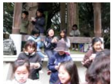
やったービンゴだ！

前日まで天気が悪く開催が危ぶまれましたが、関係者一同の祈りが天に通じたのか朝には雨が止み、なんとか無事に実施す