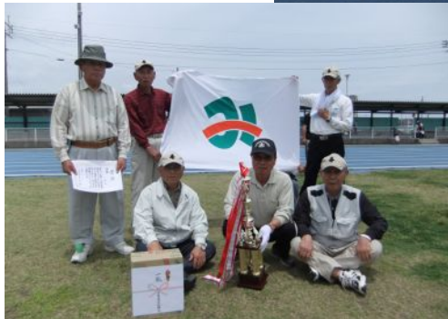
団体の部優勝 南寿楽会Aのみなさん