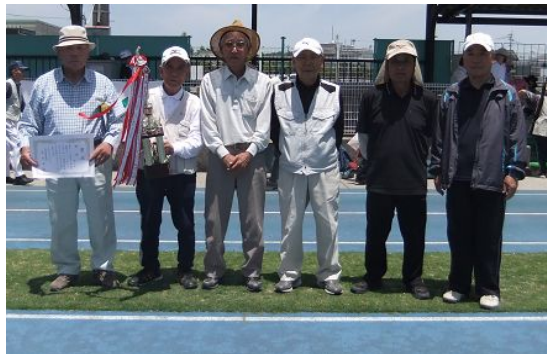
← 団体の部優勝 南寿楽会Aのみなさん

5月27日に本渡運動公園陸上競技場において、第13回本渡南地区グラウンドゴルフ大会をさわやかな絶好の天気の中、開催することができました。当日は31団体、177名の方に参加して頂き、盛会の内に競技が終了いたしました。入賞者は次のとおりです。これからも健康を保ち、練習を積み、来年度以降も参加して頂きますようお願いいたします。