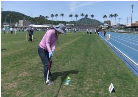
↑ ↓ プレーの様子