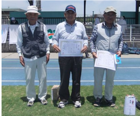
↑ 個人の部入賞のみなさん