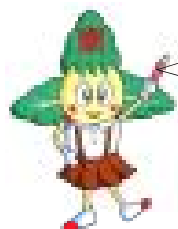
(本校キャラクター かしわば南ちゃん)

平成24年度も本渡南小学校では、本校の教育活動を保護者・地域の皆様理解にいただくため、「本渡南小学校へ行こうデー」の取組を計画しています。