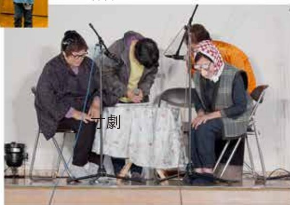
下田南寸劇グループ