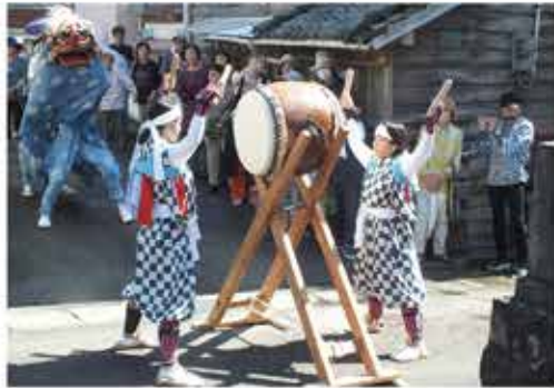
太鼓踊り 八坂神社