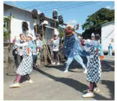
太鼓踊り 稲荷神社

去る10月5日曜日、快晴に恵まれて秋季大祭が執り行われました。汐ふり、はさみ箱、鳥毛振り、神輿と練り歩きます。今年も秋の総りに感謝して各神社では太鼓演舞、獅子舞が奉納されました。