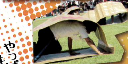
やっぱり 昔んしはジヨウズー！