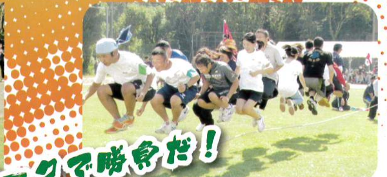
チームワークで勝負だ！