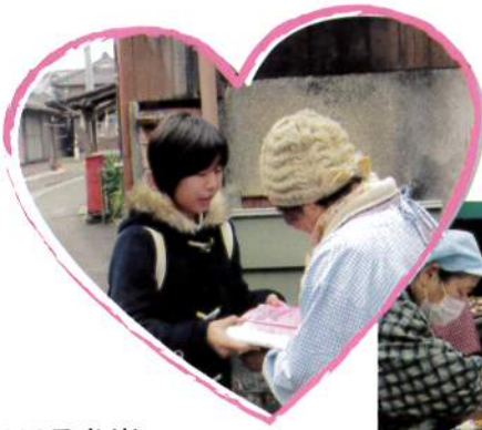
まごころ弁当 ふれあい交流会