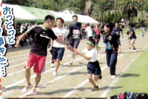
おっっっっ 行き過ぎたー！