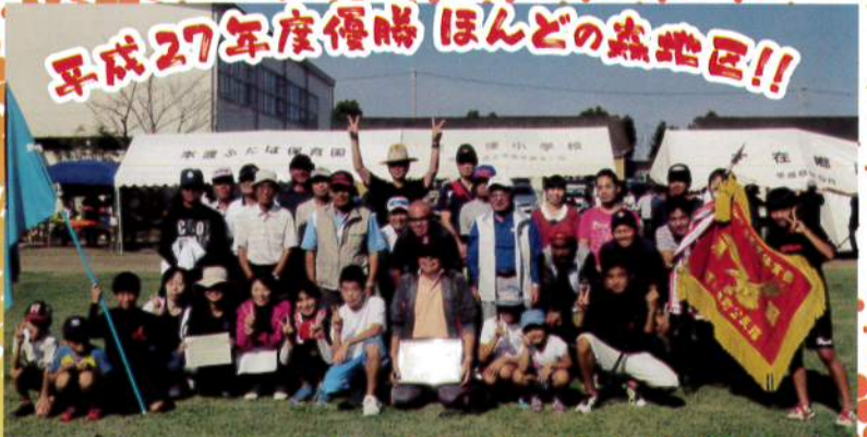
平成27年度優勝 ほんどの森地区!!