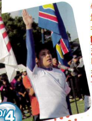
今年も始まります