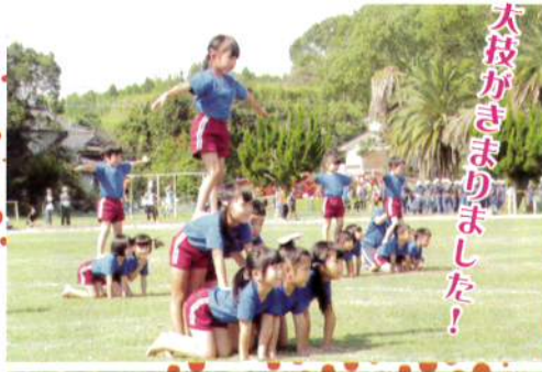
大技がきまりました！