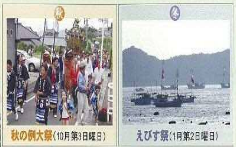
秋の例大祭(10月第3日曜日)