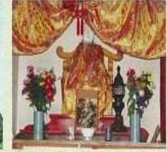
⑥八十八カ所(御大師様)

宮田の中心にあり、かつて古城のあったところとされています。天草四郎が棚底方面から攻めて落城させたという話もあります。