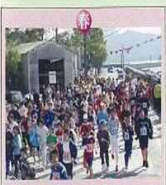
ベアーマラソン大会(3月中旬)