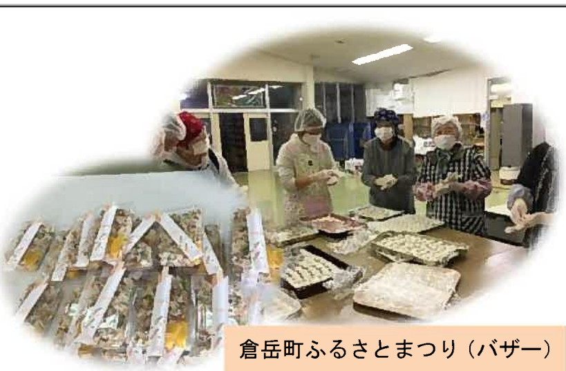
倉岳町ふるさとまつり（バザー）