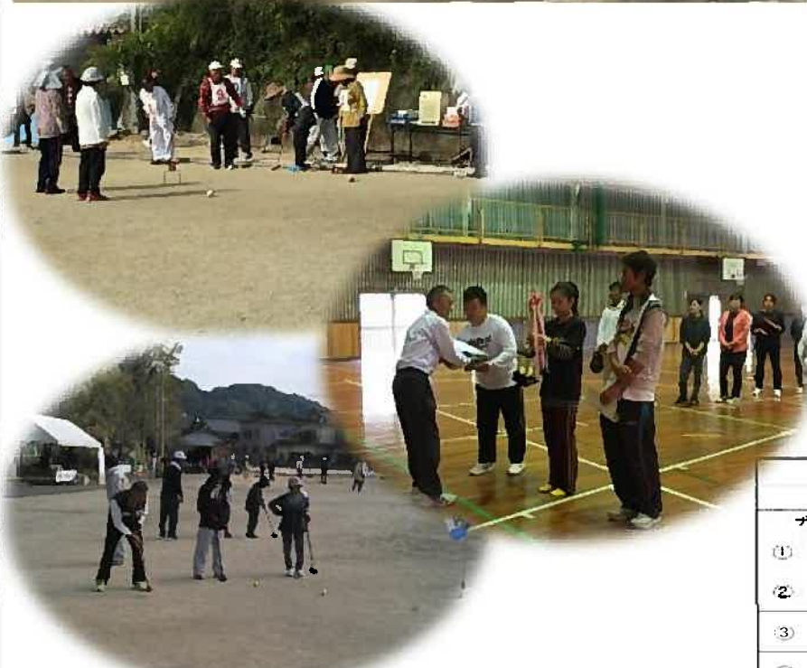
第24回 宮田地区分館対抗球技大会 グラウンドゴルフの部 成績表