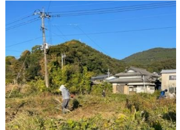
旧 JA 跡地