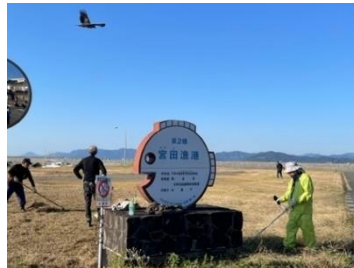
浜田ゲートボール場下