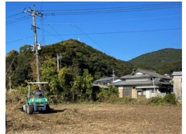
旧 JA 跡地