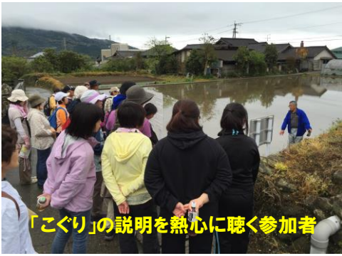
「こぐり」の説明を熱心に聴く参加者