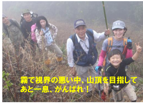
霧で視界の悪い中、山頂を目指してあと一息、がんばれ!