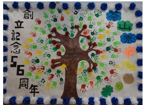
廊下に飾られた利用者・職員の手形の木

利用者の方に至っては、苓山寮では60名中17名の方が50年以上生活され、第二苓山寮でも30名中9名の方が当初より生活されています。施設では毎年この記念日を利用者、職員共にお祝いします。