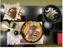
←ホテル岬亭の夕食：美味しかったあ

天草の秋空、右手には紅葉の山々、左手には青い海と潮の香り、自然を満喫しながらいざ出発。久しぶりのバスの旅にみなさん気持ちが高ぶられている様子でした。