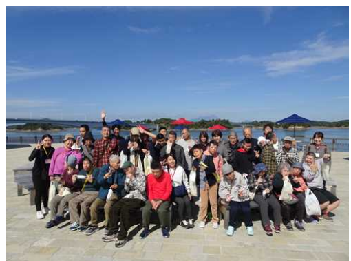
最高の旅行日より：リゾラテラス