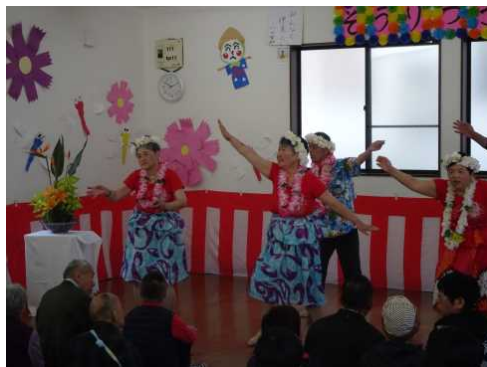
行事の際、みなさんの前でフリフリ