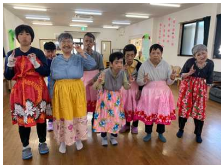
月に1回のサークルは楽しいよ

もう20年以上活動されている方も何名もおられ、音楽が流れると自然とフラの基本中の基本「笑顔」になられます。好きに気ままに踊られることができるそんなココナッツクラブが好きなのでしょう。平均年齢は年々上がりますが、他のみなさんを取り込み、踊りたいという気持ちと情熱を持ち続けてほしいです。