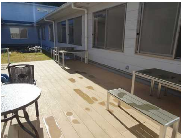
↑ 晴れた日はこのテラスでランチ