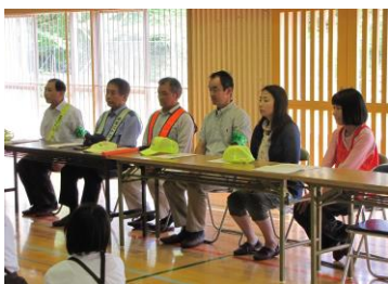
【地域みまもり隊発足式】