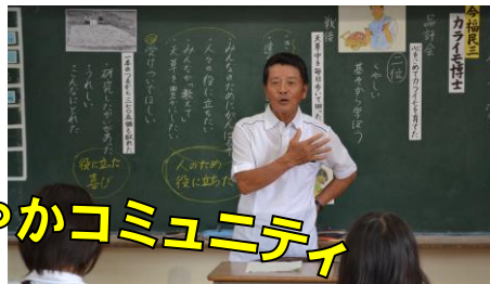
【6年道徳「カライモ博士」】