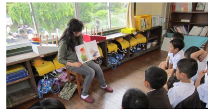
【1年国語「おはなしよんで」】