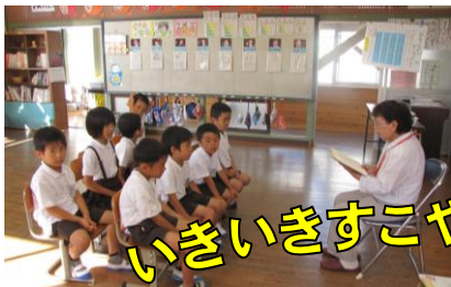
【むくろじ読み聞かせ】