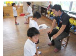
【12年学習支援ボランティア】