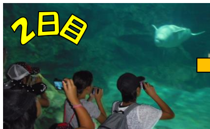
↑水族館でイルカを見ました