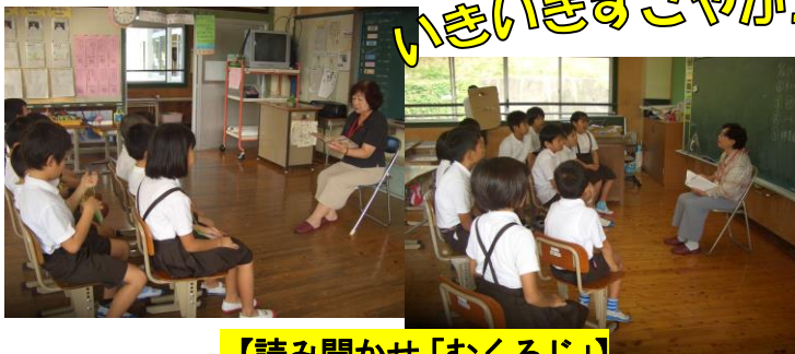
【読み聞かせ「むくろじ」】