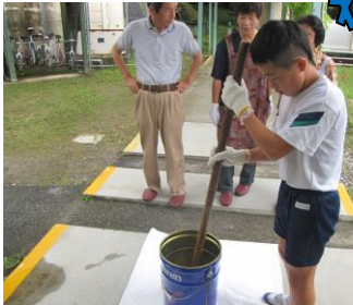
【廃油石けんづくり】