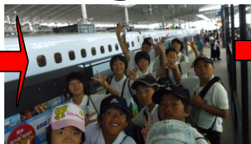
↑新幹線で名古屋まで