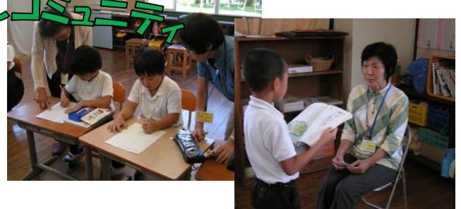
【1・2年学習支援ボランティア】