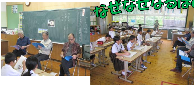
【4年国語「ごんぎつね」】