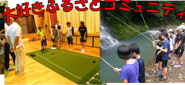
木好きふるさとコミュニティ