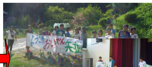
↑矢並のみなさんが温かく迎えてくれました