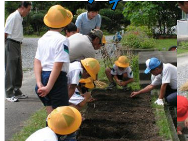
【1・2年野菜の種をうえよう】