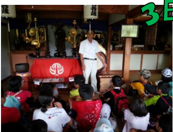
↑心月院と恩真寺でお話を聞きました