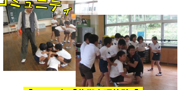
【2・4年「芸術表現体験」】