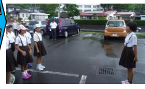
↑無事に帰ってきました