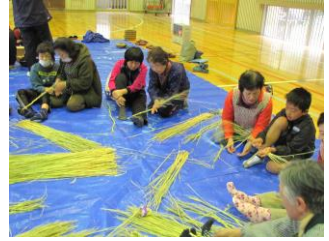
【5年「稲刈り・脱穀」～「わらを使って」】