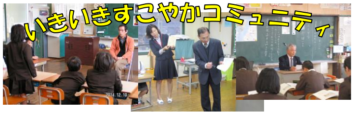
わくわくふれあいコミュニティ