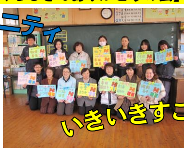
【むくろじさんありがとうの会】