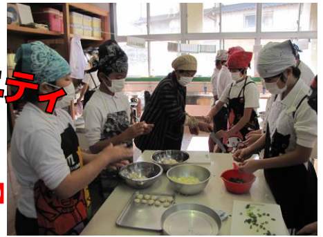
【6年「郷土料理づくり」】