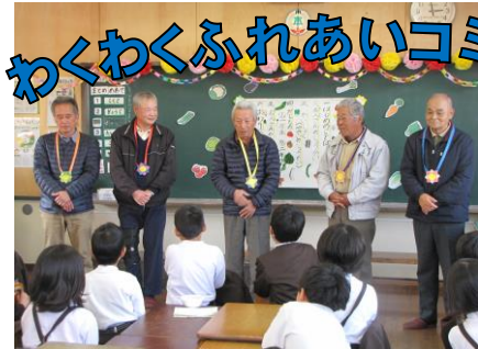
【1・2年「野菜名人さんありがとうの会」】