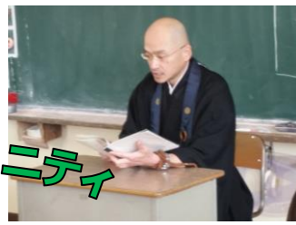
【3年社会 「昔の暮らし・道具」】