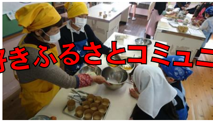
【特別支援学級「おやつづくり」】