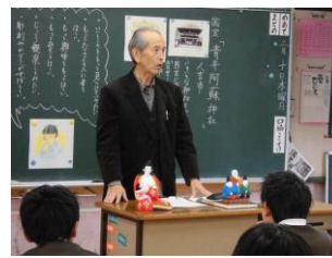
【2・4・5年「道徳の時間」】