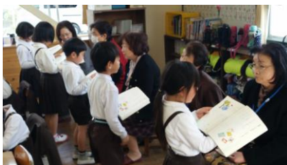
【1・2年 「学習支援 ボランティア」】