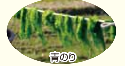
青のり 2 シロウオ漁