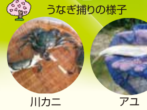
うなぎ捕りの様子 川カニ アユ

8 大宮地川 天草島内でも上位に属する大きな川で大宮地渓谷に沿って流れています。