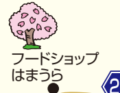
フードショップ はまはら