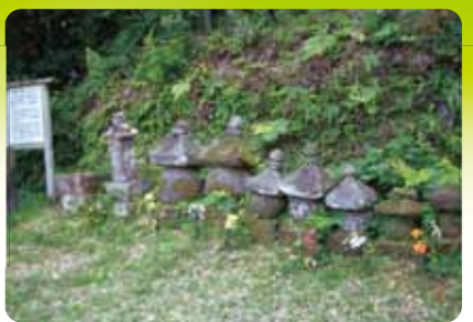
ごりんのとう 6 五輪塔

大宮地小学校は明治7年に創設され、約130年の輝かしい歴史と伝統を築いてきました。これは鎌倉時代、天草氏の一族で、志岐氏と一時争った宮路氏ゆかりのものであるといわれています。