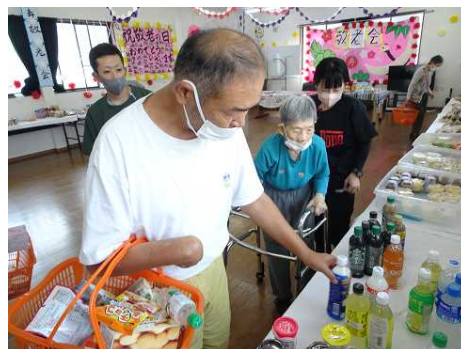
↑ジュースも買います