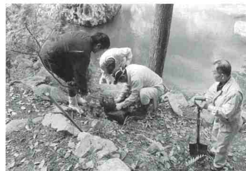
▲もみじの植樹のようす