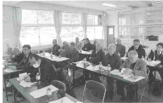
▲かさおか島づくり海社での研修

「まちづくり研修」事業は、まちづくりを推進する人材の発掘と育成を目的として、県内外の先進地を訪問し研修を行う事業です。 本年度は、平成29年2月14日から15日まで、岡山県の笠岡市と倉敷市を訪問し、本協議会委員など17人の参加がありました。