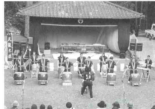
▲天草支援学校による天竜太鼓