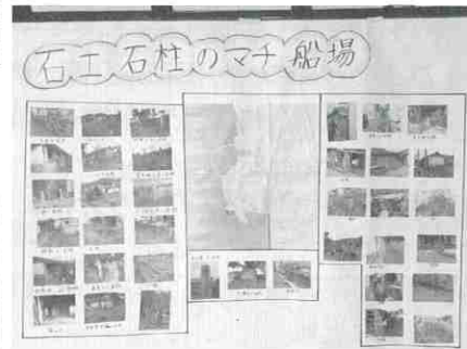
▲成果品「あるものマップ」

第3回は2人1組に分かれて、地区の住民の方に地域の歴史、お仕事、歩んでこられた人生のお話を伺って文章として記録する「聞き書き」を行いました。 第4回は、第2回、第3回で調査したものをまとめ、地元の公民館で地区の住民の方の前に成果発表を行いました。