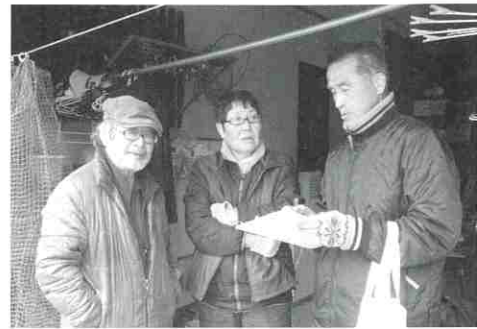
▲5項目アンケートのようす

第1回：平成29年1月11日 第2回：平成29年1月22日 第3回：平成29年2月12日 第4回：平成29年2月19日