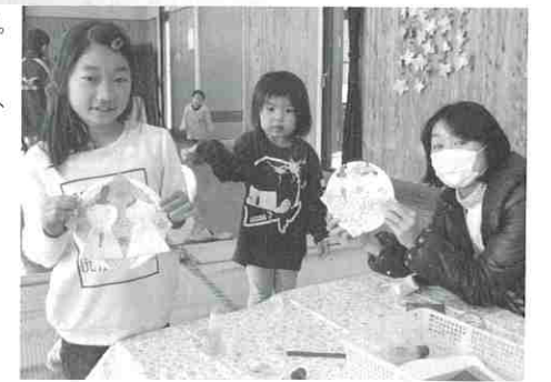
▲可愛いお雛様ができました♪

亀場地区では、毎年、「お雛様会」を開催しています。今年は、平成29年2月26日に開催し、幼児、小学生と保護者を含め、約80人の参加がありました。まず、みんなで「うれしいひなまつり」の合唱や紙芝居、メインの折り紙でのお雛様作りでは、お友達や保護者と一緒に可愛いお雛様を作りました。作ったお雛様を持って記念撮影をパチャ!そうこうしているうちにお腹が減りました。お昼ごはんは、チラシ寿しにからあげなどみんなでおいしく食べました。会の最後には、運試しのピンゴゲームで盛り上がりました。未来を担う「亀っ子」がすくすく育っていくことが楽しみです。