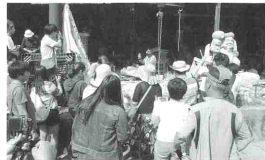
▲石工調査のようす

下浦石工文化・歴史を検証し、まちづくりに活かしていくため、九州大学を始めとした大勢の方とともに下浦地区を調査し、「よそもの・わかもの・ばかもの」の視点から、さまざまな下浦の可能性を発掘しました。下浦石工の歴史本の作成、下浦の情報を発信するためのホームページの立ち上げ、石工場跡地を整備してイベントに使用するなど、この事業をきっかけとして新しい取り組みが多数生まれ、下浦に新しい風が吹き込まれました。