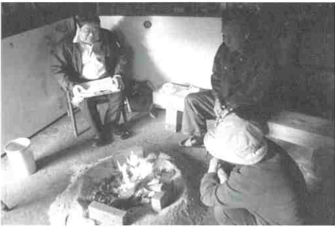
▲聞き書きのようす

笠岡市では、第6回地域再生大賞を受賞した「NPO法人かさおか島づくり海社」を視察。同社の石井事務局長から笠岡諸島の現状やこれまで取り組まれてきたこと（島の運動会や買い物支援）などをご説明いただきました。その後の意見交換では、委員から買い物支援やコミュニティバス、デイサービスなどの事業についてさまざまな質問が出されました。その後、同社が市から指定管理を受け運営している「石切の杜（宿泊研修施設及び高齢者共同生活住宅）」の運営状況などの説明を受けました。 倉敷市では、市民活動推進課の職員の方から同市の住民