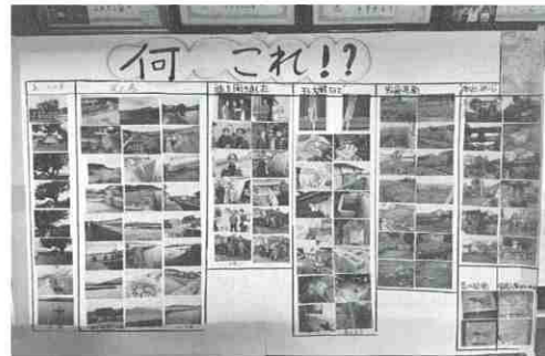
▲成果品「何これマップ」