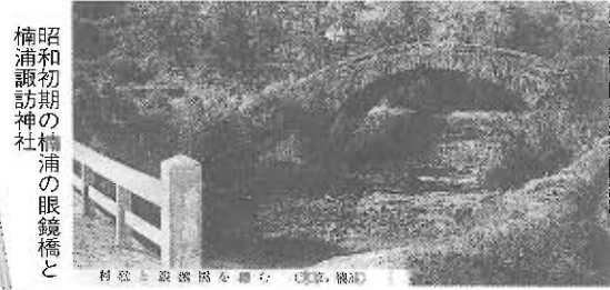
楠浦町誌の発行式 昭和初期の楠浦の眼鏡橋と

本渡地区の学校や図書館、町内の全世帯には無償で、その他の希望者には有償でお届けしました。残りわずかとなりましたので、興味がある方は、ご一報ください。また、中央図書館にも展示されていますのでご覧ください。