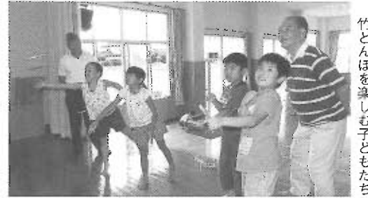
竹とんぼを楽しんでいる子どもたち