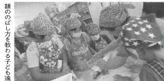
種類のばし方を教わる子ども達

おいしい食事の後は、老人会のおじいさん達に講師になっていただき、広告紙を使った紙飛行機や小豆を入れたお手玉を作った遊びました。教える方も教わる方も楽しい時間を過ごすことができ好評でした。