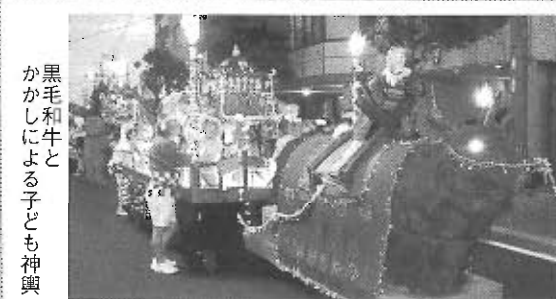
黒毛和牛と かかしによる子ども神輿

11月10日(日)には、天草市民センターで開催される「御々譜女声合唱団コールすみれ 第10回定期演奏会」に出演します。この演奏会の収益の一部は、大水害の復興支援金として「阿蘇市」へ贈られます。興味のある方は、ぜひご来場下さい。