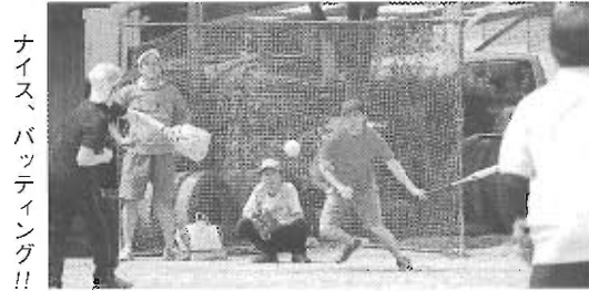
ナイス、バッティング!!

本大会は今年で30回目を数え、本地区のスポーツ行事としては一番歴史のある大会です。大会後はそれぞれのチームで反省会を行ない、試合での好プレー珍プレーを振り返りながら、楽しい1日を過ごし、大会の目的である地域住民の親睦と融和を深めることができました。