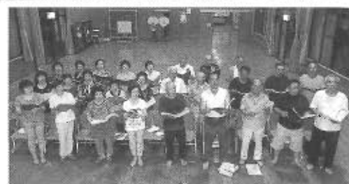
「心をひとつに」 素晴らしい歌声を届けます